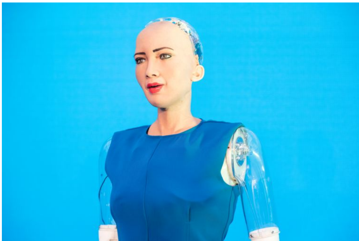
De 'menselijke' robot Sophia.

'Robots kunnen toonbeelden van compassie zijn. Dan moet dat mensen toch ook lukken.' Sophia, zittend op het hoofdpodium van Bright Day, de benen ferm over elkaar geslagen, grinnikt om haar